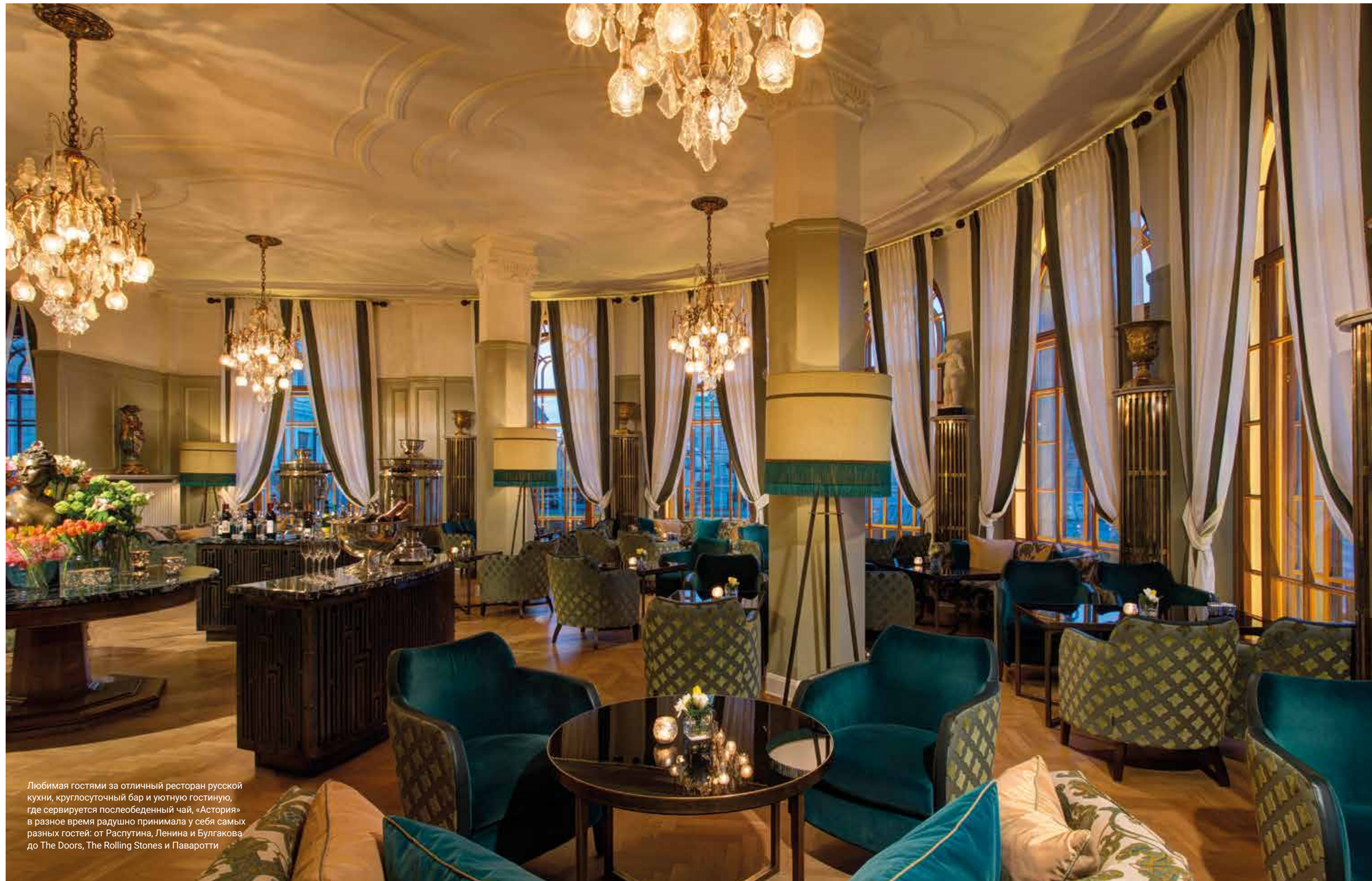
Любимая гостями за отличный ресторан русской кухни, круглосуточный бар и уютную гостиную, где сервируется послеобеденный чай, «Астория» в разное время радушно принимала у себя самых разных гостей: от Распутина, Ленина и Булгакова до The Doors, The Rolling Stones и Пavarотти